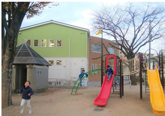
公園の四分の一を保育園に転用した東原公園で遊ぶ児童

私は、認可保育園の整備で子育てと仕事が両立できることが最重要課題と考えてきました。非正規雇用が増える現状で、この課題が実現できたことを高く評価します。次の課題は、区立保育園が育ててきた保育の質を、新設された私立保育園に継承する取り組みです。区立保育園を守り、区立園が核となり私立保育園の質を支えることです。お子さんやお孫さんを安心して託せる保育を実現する体制を求めています。